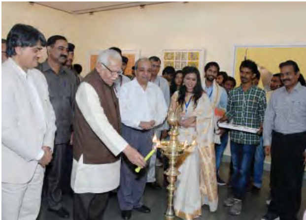
प्रदर्शनी का शुभारम्भ करते माननीय राज्यपाल