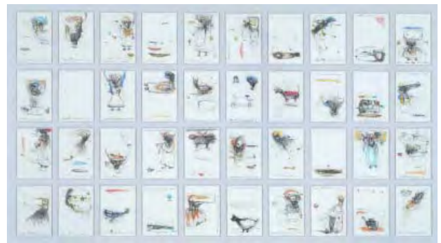
धीरज यादव - अनटाइटलड 40