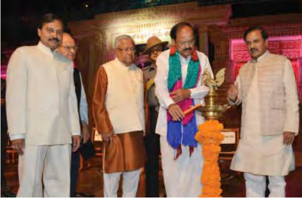
आई.जी.एन.सी.ए.में महोत्सव का शुभारम्भ करते शहारी विकास मन्त्री श्री वेंकै संस्कृति मन्त्री डॉ. महेश शर्मा