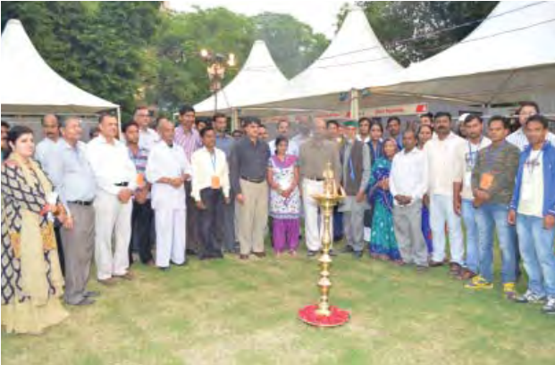
रवीन्द्र भवन में राष्ट्रीय संस्कृति महोत्सव के कला मंडप शुभारम्भ पर प्रशासक, सचिव तथा अन्य