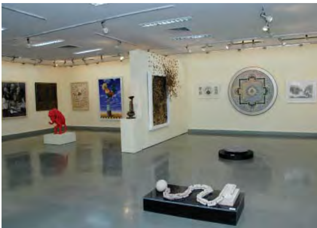
राष्ट्रीय कला प्रदर्शनी का एक दृश्य