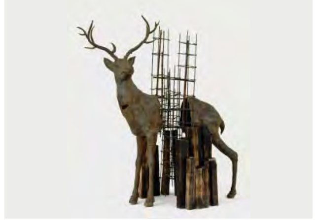
माधव दास - ऐन इनकॉन्विनिएन्ट टूथ