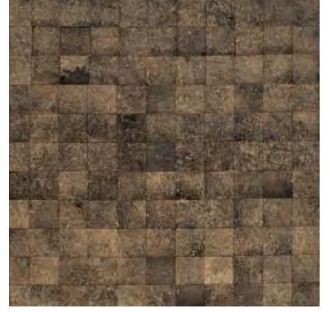
शरद सोनकुसले - अनटाइटलड-I