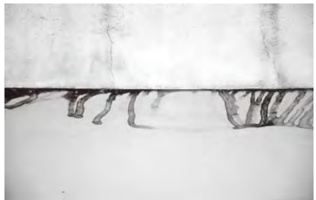
रवीन्द्र कुमार - आर्ट है