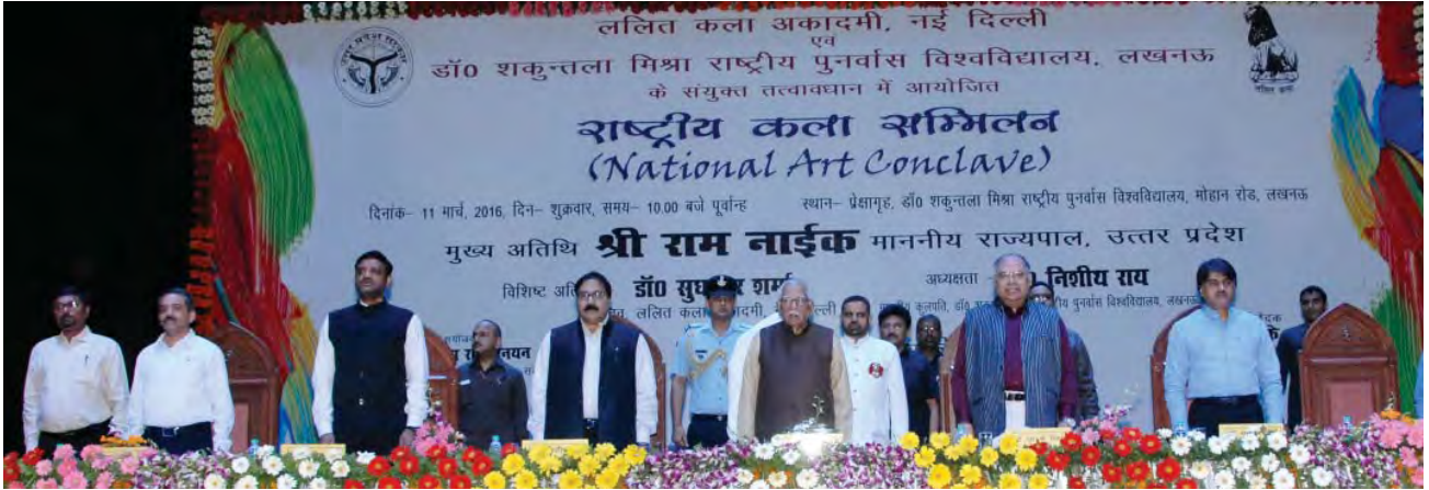
राष्ट्रीय कला सम्मिलन के शुभारम्भ के अवसर पर माननीय राज्यपाल (उ.प्र.) श्री राम नाईक औ