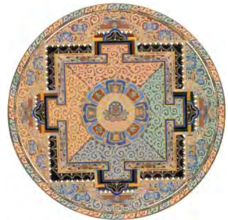
प्रतीक्षा अपूर्व - कास्मिक वै