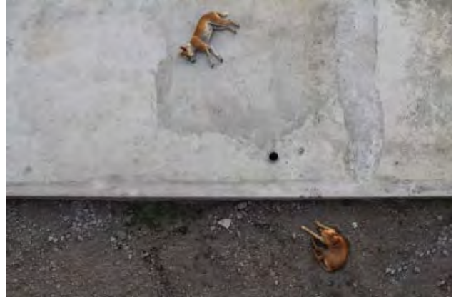
राधाकृष्ण राव - विश्रान्ति