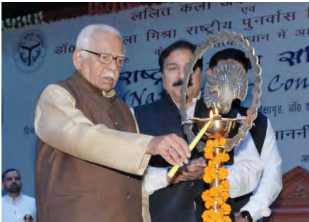
सम्मिलन का शुभारम्भ करते माननीय राज्यपाल