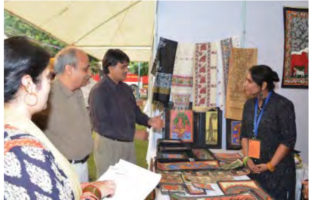
कला मंडप में कृतियाँ देखते प्रशासक और चित्र