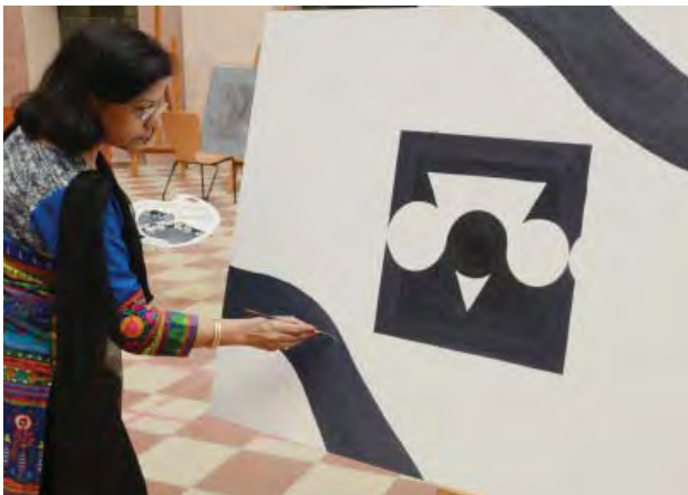
कला सम्मिलन में कार्यरत कलाकार