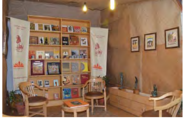
महोत्सव में आई.जी.एन.सी.ए.में अकादेमी का विक्रय केन्द्र