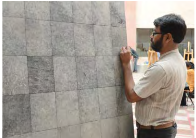
सम्मिलन के कार्यरत कलाकार