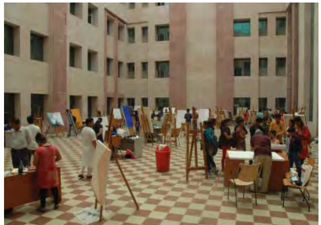
सम्मिलन का कार्यस्थल