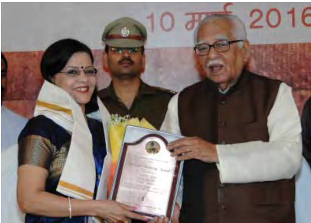
प्रतीक्षा अपूर्व उत्तर प्रदेश के माननीय राज्यपाल से पुरस्कार ग्रहण करती हुई