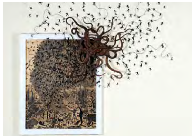
लोकनाथ प्रधान- 31 दिसम्बर