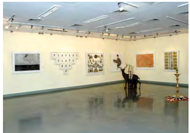
राष्ट्रीय कला प्रदर्शनी का एक दृश्य