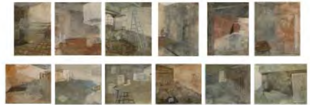
पूजा मॉडल - द मोनोलॉग ऑफ स्पेसेज