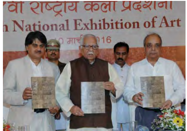
प्रदर्शनी केटलॉग का लोकार्पण